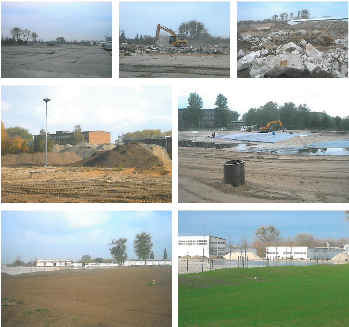
Bauarbeiten im Golfpark Dessau ab 2007.

Wir freuen uns, auch im Jahr 2022 mit dem Übernahmejubiläum ein kleines Stück Geschichte zu schreiben und sind gespannt, was die kommenden 15 Jahre bereithalten werden.