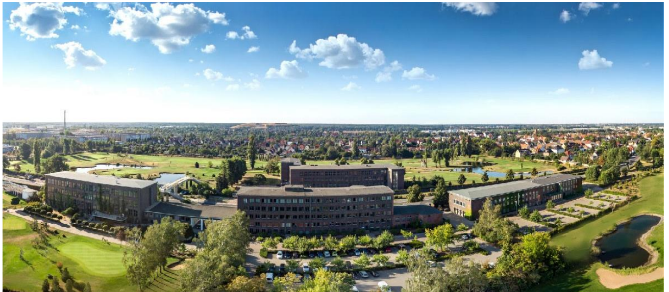
Golfpark Dessau heute.

Herausgegeben von der Presseabteilung der