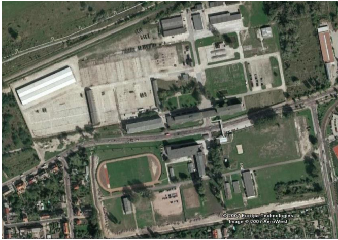
Golfpark Dessau 2007.